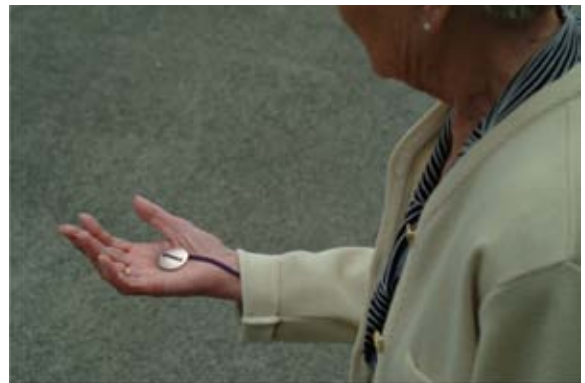
Maria a senti la présence du poussoir au creux de sa main. Elle ne sait plus où elle se trouve ni comment retourner chez elle.

Le cadran propose de séquencer la journée en quatre plages horaires sur 24 heures. Celles-ci sont délimitées par l'heure des repas qui structurent le rythme des journées. La représentation symbolisée par la couleur propose une lecture simplifiée du temps et favorise la prise de repères entre jour et nuit.