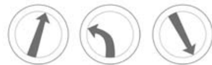
Dans cette situation, le cadran s'apparente davantage à une boussole, une flèche pour indiquer la direction à suivre. Il s'agit d'un système GPS à interface simplifiée.