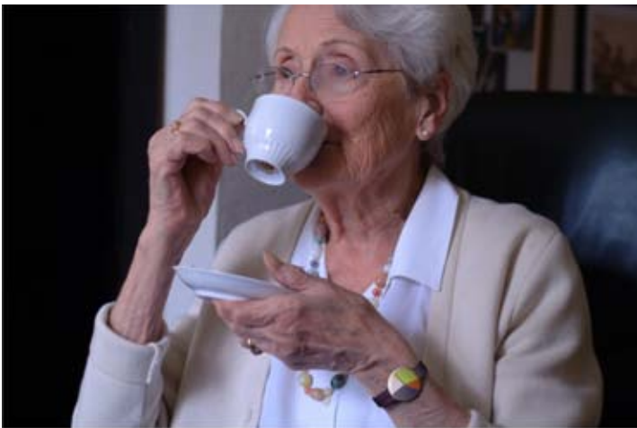
Ainsi que Maria déguste son café après un bon repas, sa montre Deci-Delà lui indique le passage dans la zone "après-midi".

La fonction montre est toujours possible en repositionnant le cadran sur sa base, mais l'aimant ne peut-être réactivé qu'au retour à domicile.